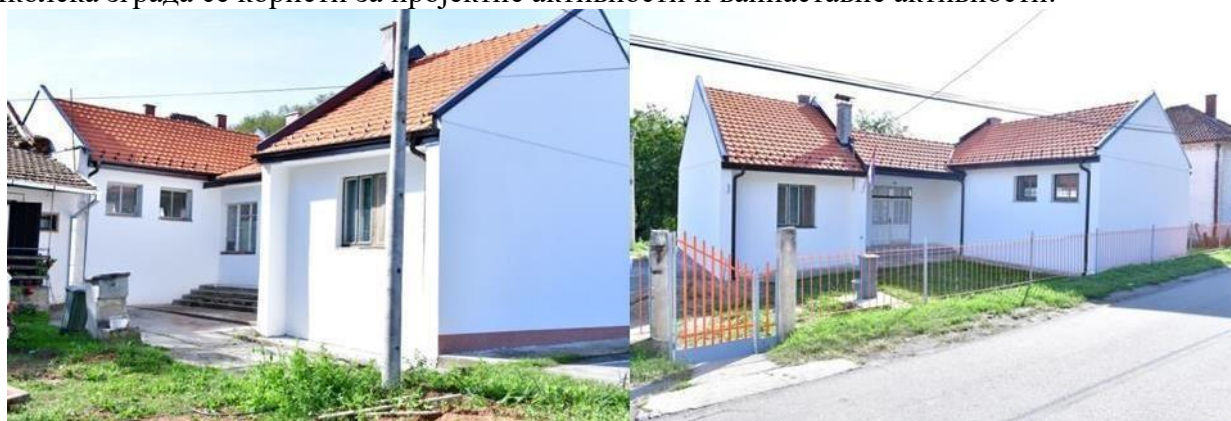
ОШ „Свети Сава“ –Издвојено одељење Рамнице