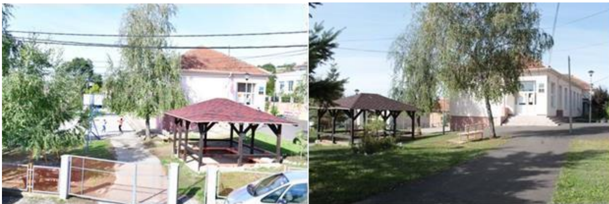
ОШ „Свети Сава“ – Издвојено одељење Доња Мала